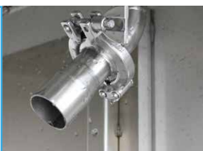
Preso interna per lavaggio tubi Internal valve for pipe washing