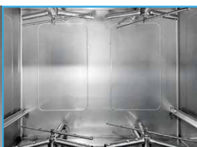
Aste lavaggio e risciacquo INOX Washing and rinsing stainless steel rods