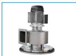
Aspiratore vapori Suction steam device